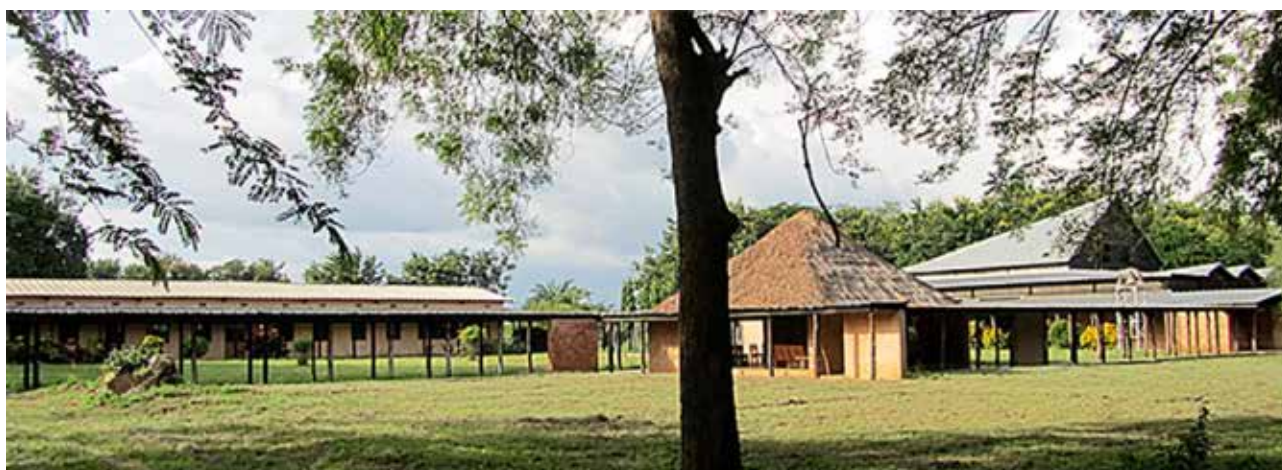
Le monastère de Sainte Marie de Bouaké

Le Studium est désormais hébergé dans l'ancien Centre de Santé du monastère, réhabilité en Centre d'Etudes et hôtellerie. Le chantier de la première aile du bâtiment est aujourd'hui terminé ; les travaux de la seconde aile sont lancés. Comme ce bâtiment était initialement prévu comme hôpital, un gros travail préliminaire de maçonnerie est nécessaire pour retirer évier et paillasses. Le gros œuvre (poussière et bruit) est mené tambour battant pour que les cours dans l'autre aile puissent reprendre à partir de mars 2022 dans une atmosphère studieuse.