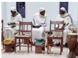
Travail de la liturgie en communauté

Bref, ce fut pour moi un cadeau de découvrir la nouvelle église, de percevoir le bonheur de la communauté qui célèbre la Gloire de Dieu. Les sœurs accompagnent la liturgie avec des instruments locaux (Kora, tam-tam etc.) et alternent des chants en français et en langues locales. Quel dépaysement !