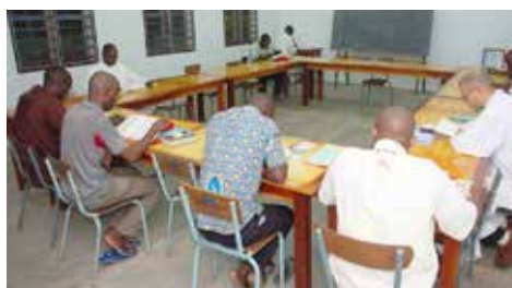
Le studium de théologie et de philosophie

Le Studium de Théologie et de Philosophie (voir l'article de Sœur Christine ci-avant) érigé dans le monastère a signé une convention avec les facultés de philosophie et de théologie de l'Université Catholique d'Afrique de l'Ouest (UCAO). Depuis 2020 ce Studium est ouvert aux moines et aux moniales de la Sous-Région. Au début de chaque année, sont dispensés les cours de théologie pendant trois mois et demi ; en fin d'année, ce sont les cours de philosophie.