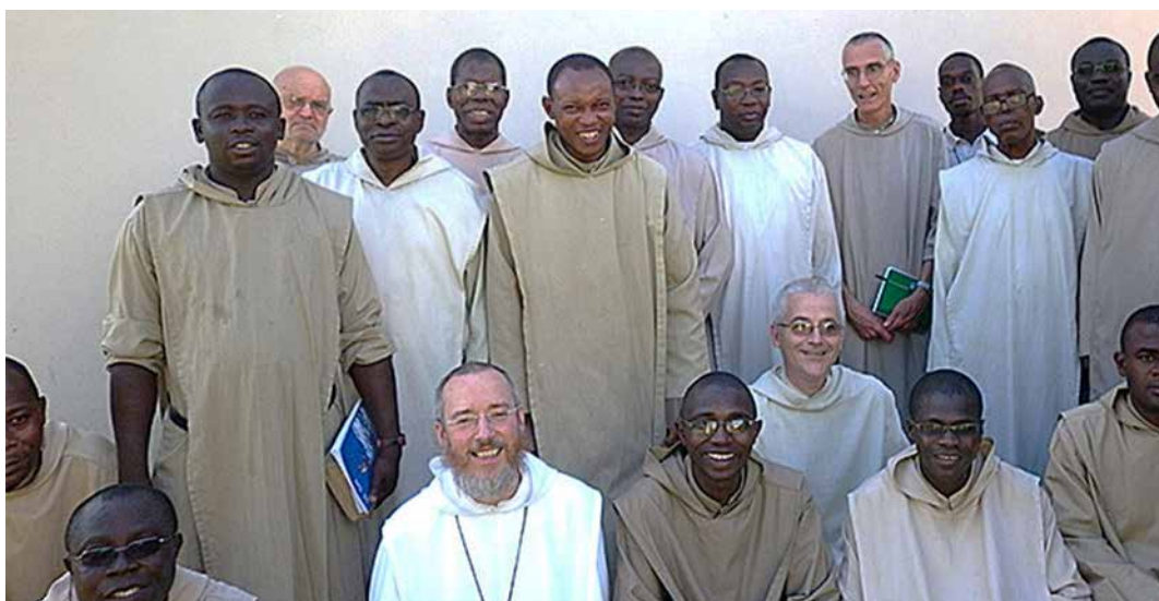
L'alliance entre les frères de Sainte Marie de Bouaké et d'En-Calcat

Tous les étudiants présents au Studium de philosophie 2021 demandent à persévérer et seront donc présents pour le Studium de théologie 2022. Deux nouveaux étudiants arrivent du monastère du Burundi. Au total quatorze étudiants sont inscrits pour le cycle de théologie 2022, dont huit sont des moines étudiants extérieurs à la communauté. Pour pouvoir couvrir les coûts de ces formations les frères sollicitent notre aide à hauteur de 11700 €.