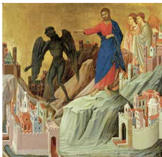
Tentation du Christ sur la montagne Duccio di Buoninsegna (Sienne - 1260)