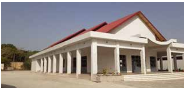
Église du monastère de la Bonne Nouvelle

Elles ont mené à bien la construction de leur nouvelle église, belle, vaste, claire, accueillante.