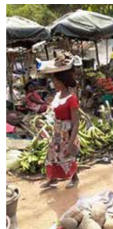
Scène de marché