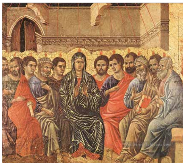
Pentecôte par Duccio Di Buoninsegna (1308)