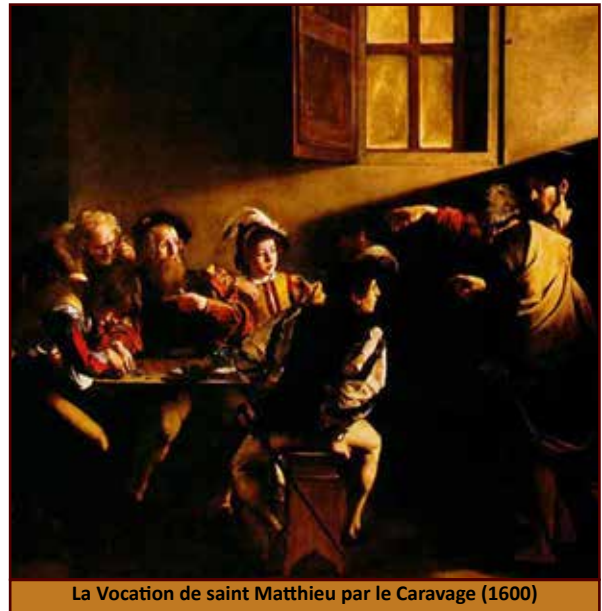
La Vocation de saint Matthieu par le Caravage (1600)

Jésus posa son regard sur lui, et il l'aima. Il lui dit : « Une seule chose te manque : va, vends ce que tu as et donne-le aux pauvres ; alors tu auras un trésor au ciel. Puis viens, suis-moi. » Mais lui, à ces mots, devint sombre et s'en alla tout triste, car il avait de grands biens. (Marc 10,21-22)