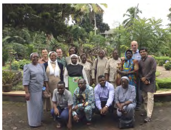
Session proposée par le MAC (2016).