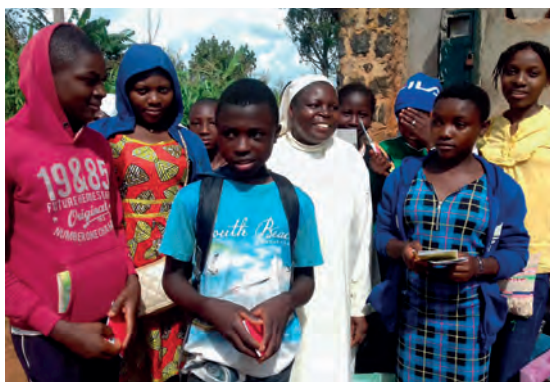
Aide à la construction d'un bâtiment pour accueillir les réfugiés (Babete, Cameroun).

La priorité des aides reste orientée vers la formation où les demandes sont très nombreuses.