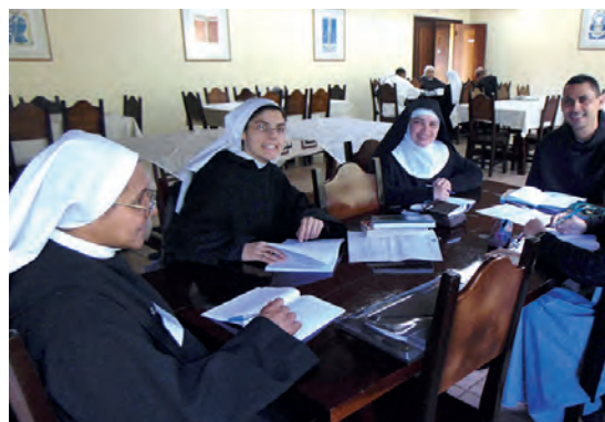
Session sur la règle de saint Benoît proposée par la CIMBRA JOVEM (2017).

Au cours de ces soixante dernières années l'AIM a accompagné la naissance de plusieurs structures continentales de solidarité monastique. La plupart des régions du monde sont dotées d'organismes qui permettent aux monastères bénédictins, cisterciens et trappistes de travailler en commun.