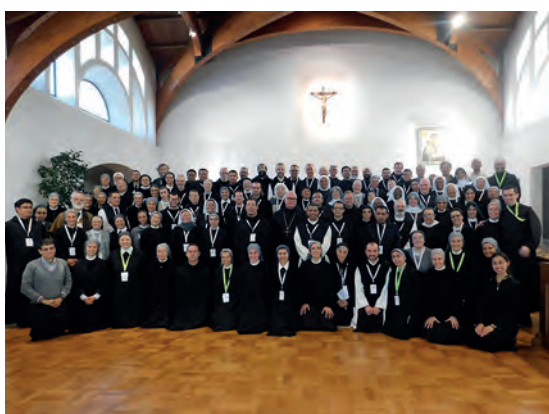
Assemblée de l'EMLA (2019).