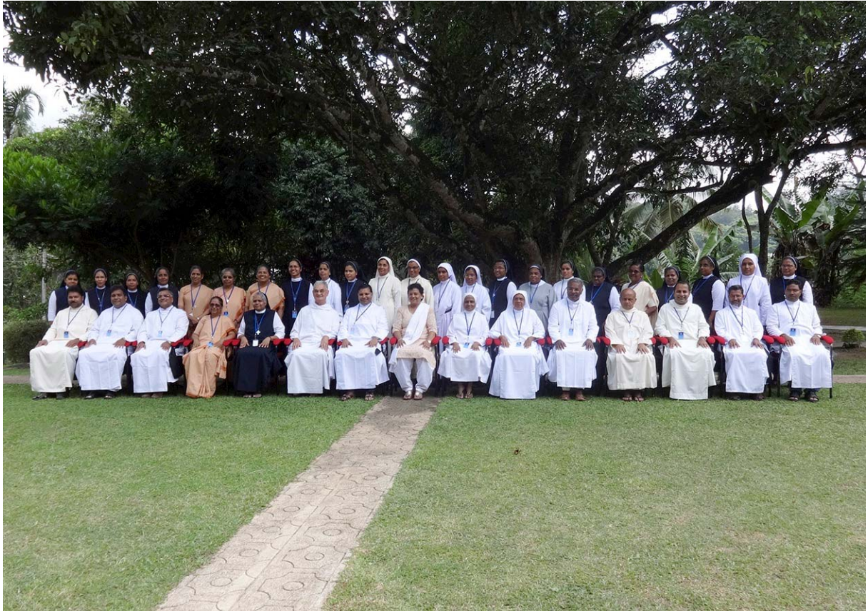
Réunion de l'ISBF