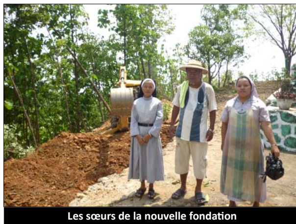
Les sœurs de la nouvelle fondation