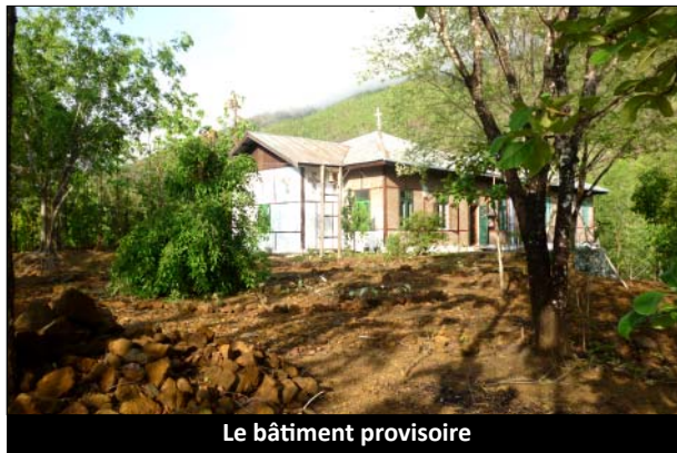
Le bâtiment provisoire