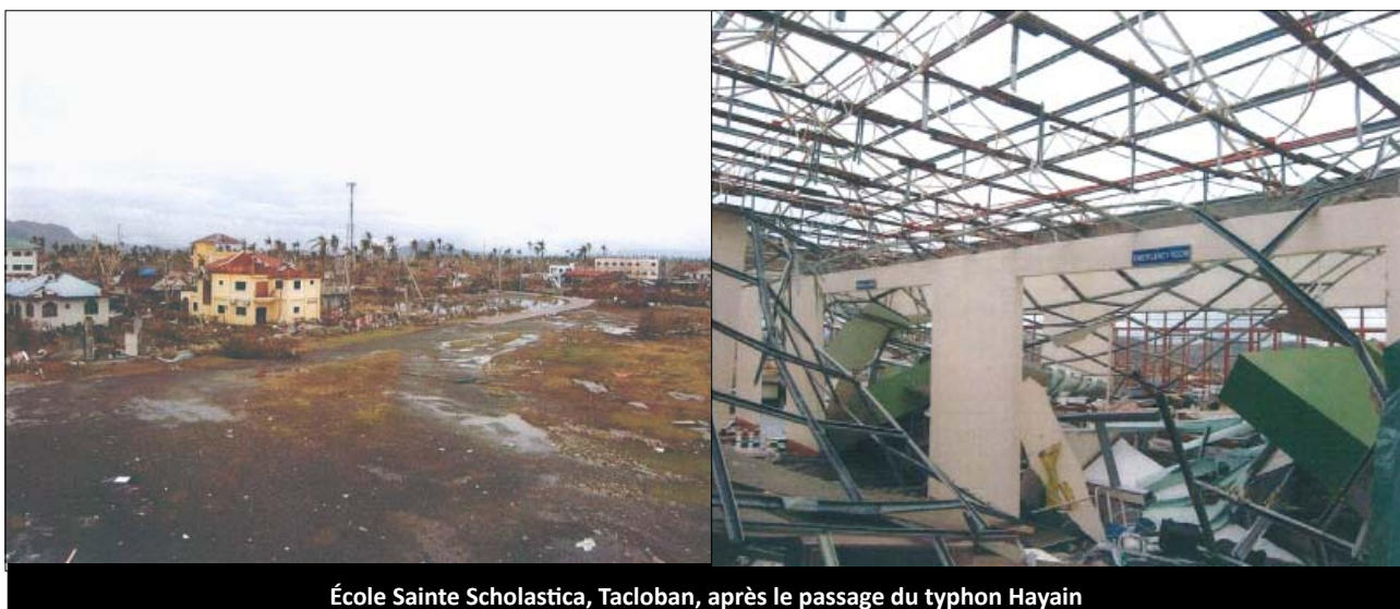
École Sainte Scholastica, Tacloban, après le passage du typhon Hayain

Notre deuxième communauté qui tient l'école Sainte Scholastica, Tacloban, est maintenant sans toit ni plafond.