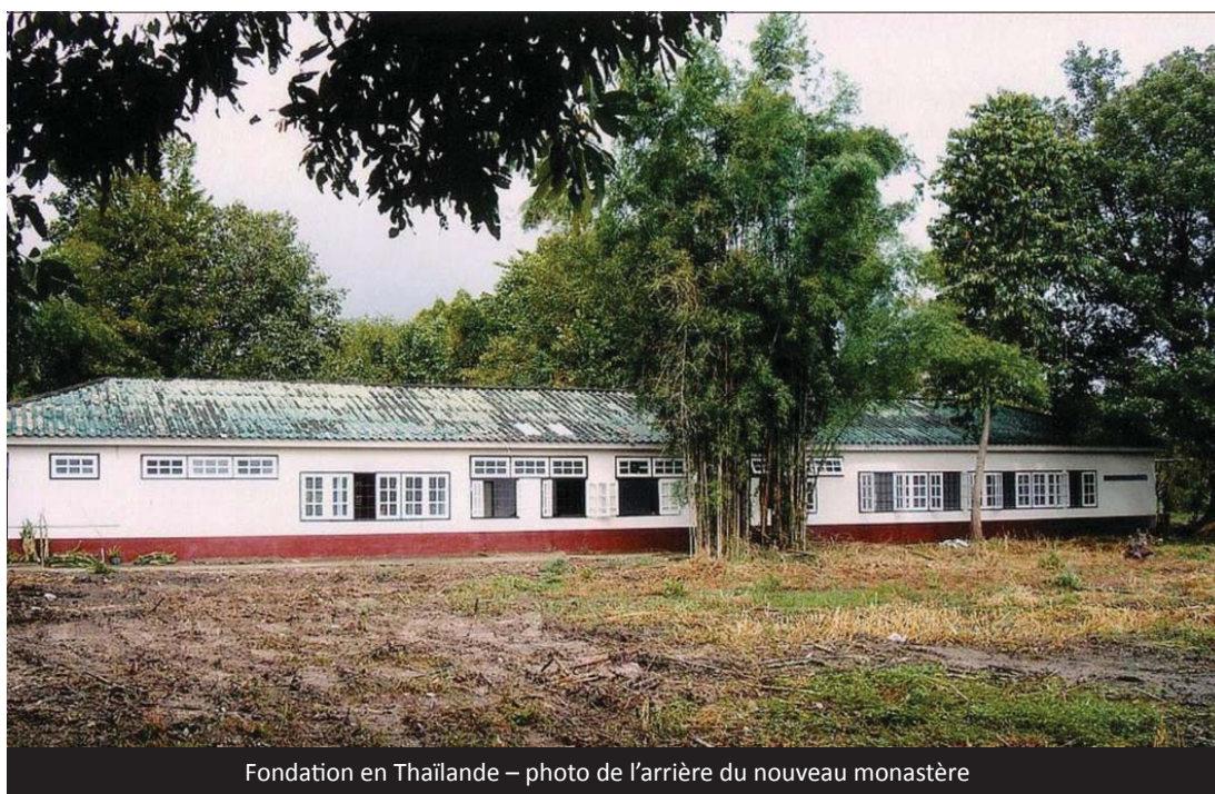
Fondation en Thaïlande – photo de l'arrière du nouveau monastère

Le dernier projet nous vient de l'abbaye bénédictine du Sacré-Cœur de THIEN AN HUE. Cette abbaye de la Congrégation de Subiaco a été fondée en 1940 par l'abbaye de la Pierre-qui-Vire. Aujourd'hui elle comprend 65 moines.