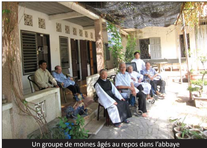
Un groupe de moines âgés au repos dans l'abbaye

Dans ce monastère, il y a un certain nombre de moines âgés (ce qui est rare au Vietnam). Ils ont traversé les années terribles de la guerre puis des persécutions antichrétiennes. Ces moines étaient jeunes à l'époque ; ils n'avaient pas encore prononcé leurs vœux. La communauté fut dispersée par le régime communiste. Ses membres ont été envoyés à la campagne dans des camps de rééducation par le travail. Ces jeunes moines y sont restés, pour la plupart, entre dix et quinze ans. Revenus dans leur communauté qui se reconstruisait, ils ont prononcé leurs vœux et trente ans après, ceux qui sont encore vivants, vivent usés par la dureté de leur vie et par la persécution qu'ils ont subie.