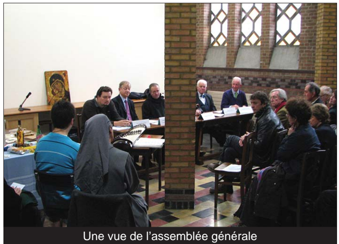
Une vue de l'assemblée générale

Il vaut la peine de se mobiliser pour aider les communautés à vivre ainsi la symbolique d'une espérance effective, dès maintenant et pour la vie sans fin.»